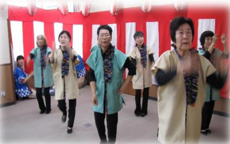
午後の部「すずらんの会様」