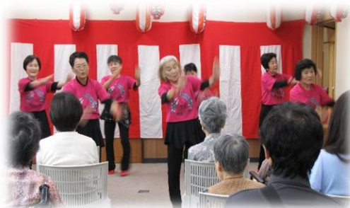
午前の部「びわの会様」