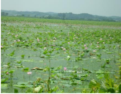
↑ ま、こんな感じでした・・・

『今年は寒い日が多かったからまだ咲いてないんじゃないの〜?』と心配しながら行ってみると、ピンクの花が満開!・・・までではなかったですが、綺麗に沢山咲いていて、みんなでホッとしました。