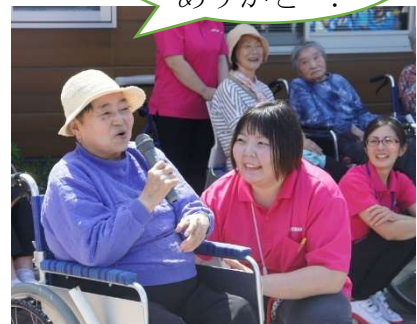
利用者様代表で、お礼の言葉